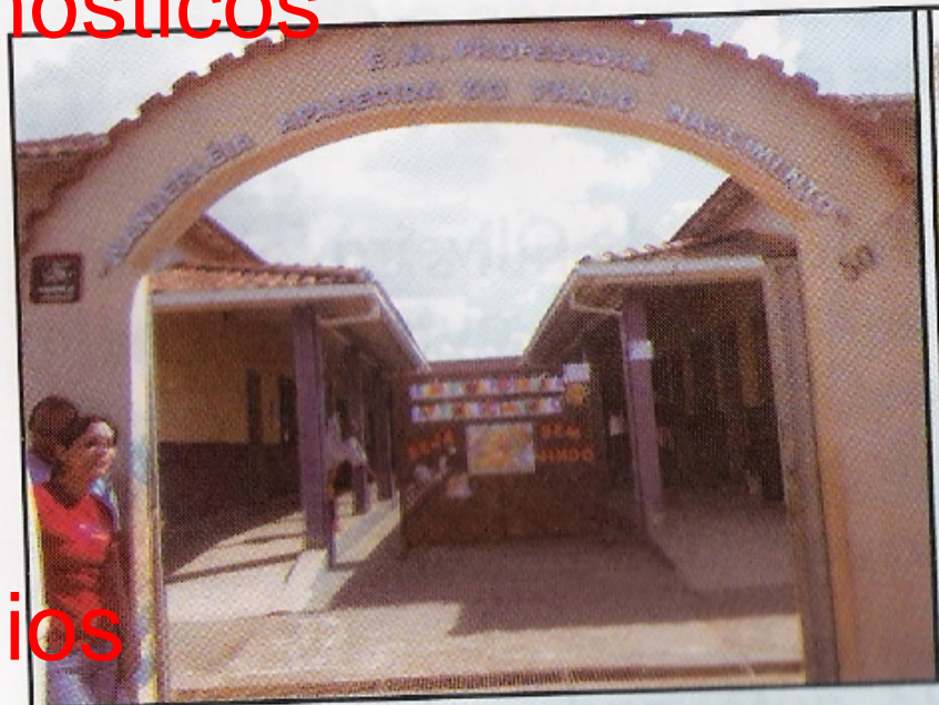
Escola Municipal Professora Wanderl