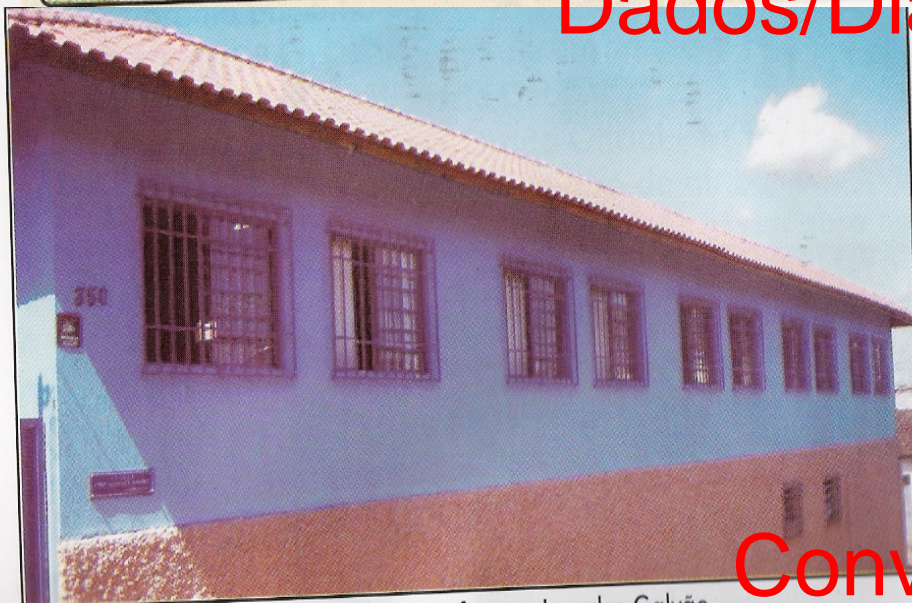
Escola Municipal Professora Lourdes Galvão