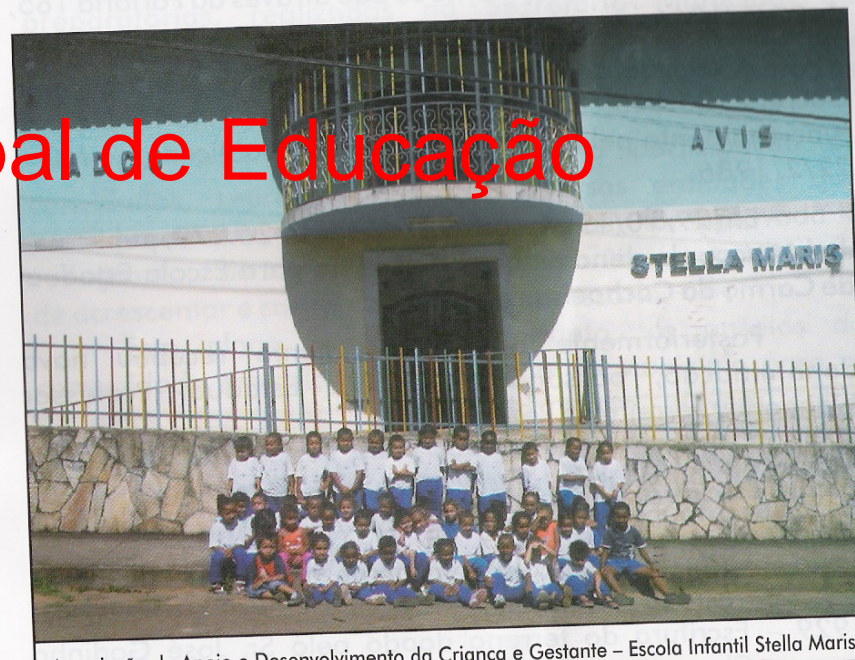
Associação de Apoio e Desenvolvimento da Criança e Gestante – Escola Infantil Stella Maris